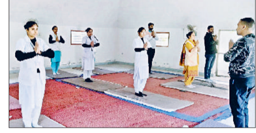
जीट। सूर्य नमस्कार की क्रिया करते स्वास्थ्य कर्मी।