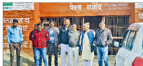
राजौड़। पैक्स कर्मचारी पानी समस्या पर रोष प्रकट करते हुए।