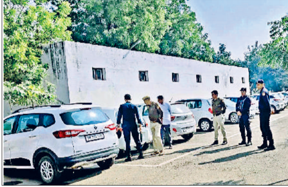
जींद। सर्च अभियान चलता हुए बम निरोधक व अन्य दस्ते।

जिला मुख्यालय अदालत को बम को उड़ाने की मेल पर मिली धमकी को लेकर वीरवार को पुलिस ने बम निरोधक दस्ते व डॉंग स्ववाड के साथ अदालत परिसर में सर्च अभियान चलाया। अदालत परिसर में आने वाले लोगों की तलाशी ली गई। सख्त लोगों को वेरिफाई भी किया गया। लगभग साढ़े चार घंटे चले सर्च अभियान के दौरान कुछ भी आपत्तिजनक नहीं मिला। हालांकि अदालतों का कामकाज सुचारु रूप से चलता रहा। लोग बाहर धूप सेकते दिखाई दिए। धमकी भरी मेल को कहां से भेजा गया, इसकी पुलिस जांच कर रही है। पुलिस के अनुसार सेशन जज की मेल पर वीरवार को सुबह