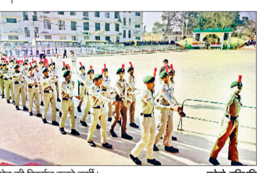
जीट। परेड की रिहर्सल करते कर्मी।