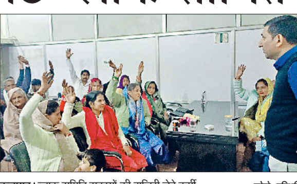
कलायत। ब्लाक समिति सदस्यों की हाजिरी लेते कर्मा