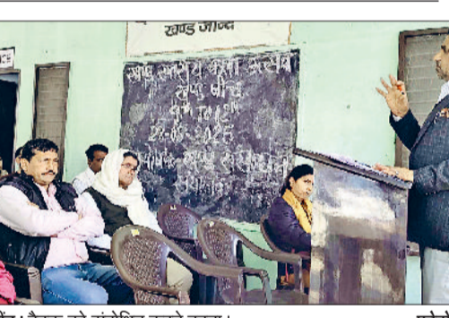
जीट। बैठक को संबोधित करते वक्ता।