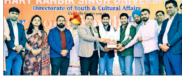
जीद। मुख्यातिथि को सम्मानित करते हुए वीसी।

विद्यार्थी शिक्षा के साथ-साथ सांस्कृतिक गतिविधियों में लें भाग मुख्य अतिथि ने अपने संबोधन में कहा कि युवा महोत्सव केवल प्रतियोगिताओं का मंच नहीं है बल्कि यह विद्यार्थियों के व्यक्तित्व निर्माण, नेतृत्व क्षमता और सामाजिक समरसता के विकास का सशक्त माध्यम है। आज का युवा ही कल का भविष्य है और ऐसे सांस्कृतिक आयोजनों के माध्यम से उनमें रचनात्मक सोच, आत्मविश्वास और अनुशासन का विकास होता है। विद्यार्थियों को चाहिए कि वे शिक्षा के साथ-साथ सांस्कृतिक गतिविधियों में भी सक्रिय रूप से भाग लें ताकि उनका सर्वांगीण विकास सुनिश्चित हो सके।