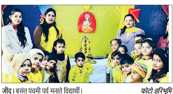
जीट। बसंत पंचमी पर्व मनाते विद्यार्थी।