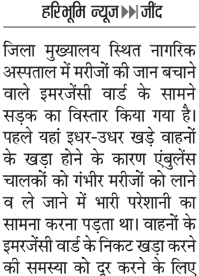
जीट। इमरजेंसी के सामने सड़क को चौड़ा करते हुए।

जिला मुख्यालय स्थित नागरिक अस्पताल में मरीजों की जान बचाने वाले इमरजेंसी वार्ड के सामने सड़क का विस्तार किया गया है। पहले यहां इधर-उधर खड़े वाहनों के खड़ा होने के कारण एंबुलेंस चालकों को गंभीर मरीजों को लाने व ले जाने में भारी परेशानी का सामना करना पड़ता था। वाहनों के इमरजेंसी वार्ड के निकट खड़ा करने की समस्या को दूर करने के लिए